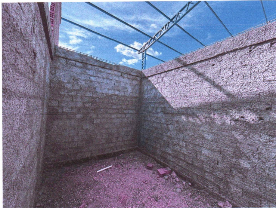
Imagem 3 – Execução da alvenaria, chapisco, armação das vigas e concretagem das vigas.