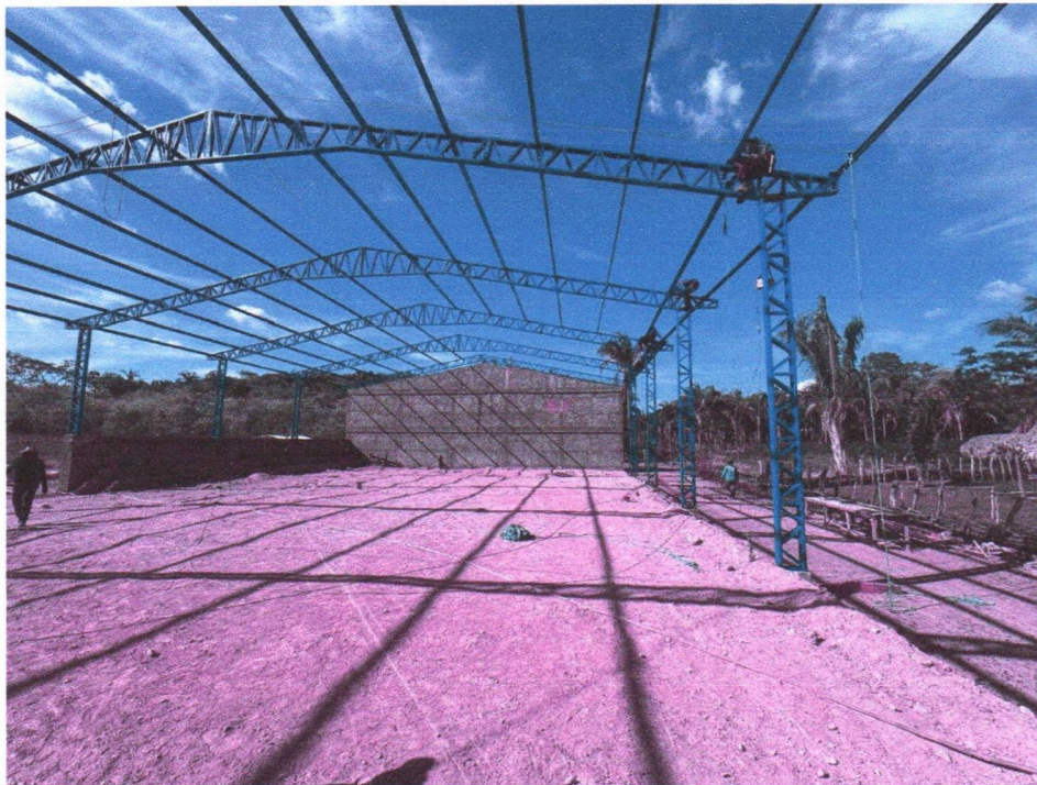
Imagem 6 – Execução da estrutura metálica da cobertura.