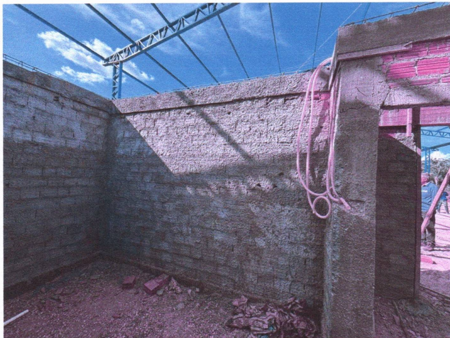
Imagem 4 – Execução da alvenaria, chapisco, armação das vigas e concretagem das vigas.