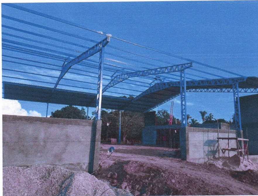
Imagem 7 – Execução da cobertura metálica.