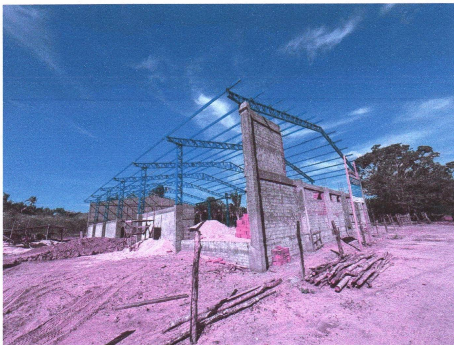
Imagem 1 – Execução da armação das vigas e instalação da estrutura metálica da cobertura.

Relatório fotográfico para 4ª medição realizada "in loco" na Quadra coberta na NO POVOADO TABULEIRO DOS BATISTAS, no município Chapadinho - MA, 65500-000.