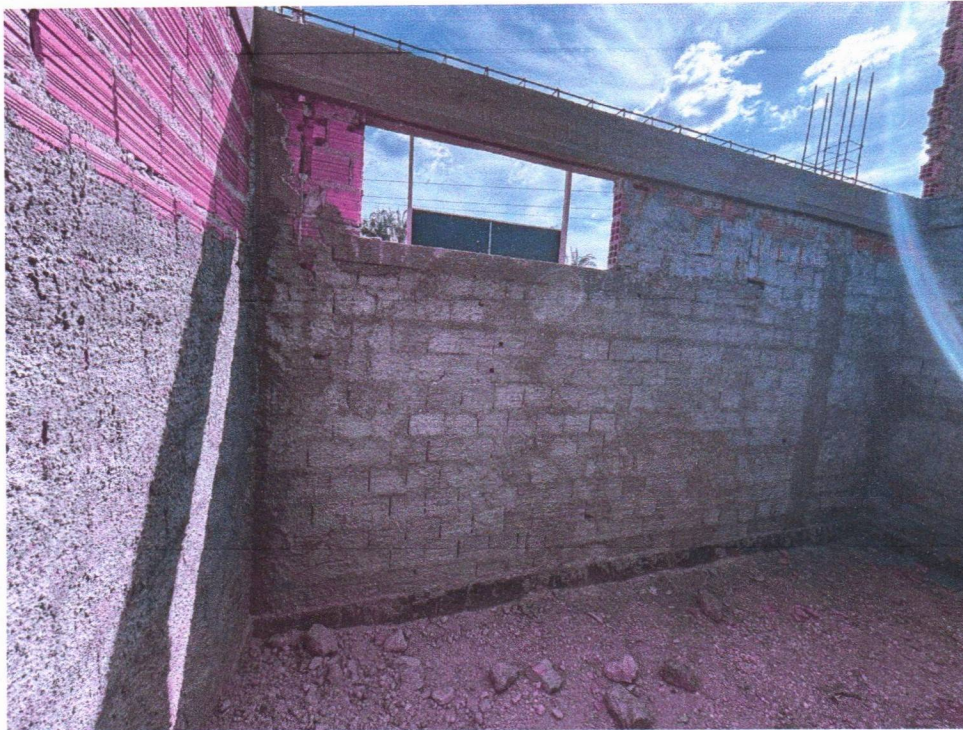
Imagem 5 – Execução da alvenaria, chapisco, armação das vigas e concretagem das vigas.