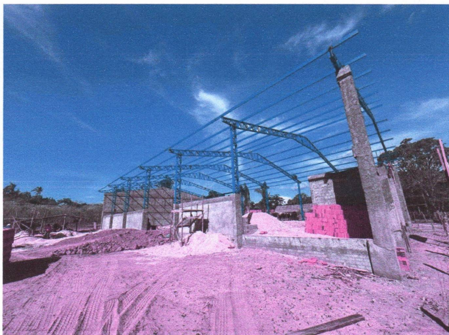
Imagem 2 – Execução da armação das vigas e instalação da estrutura metálica da cobertura.