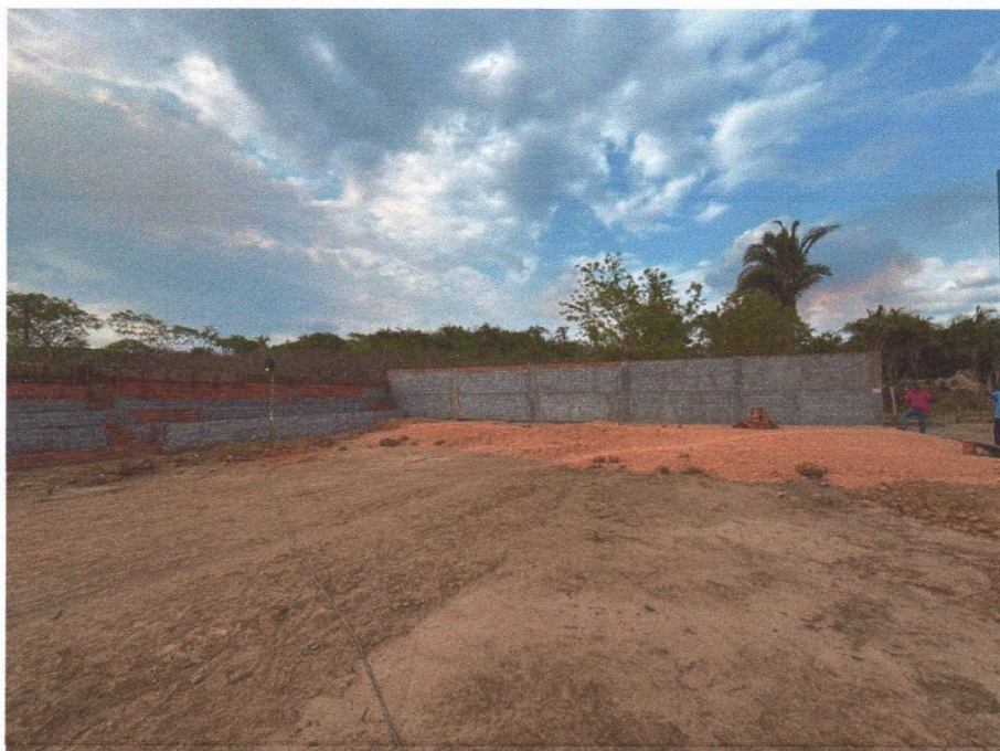
Imagem 4 – Execução da alvenaria, chapisco e aterro da quadra.