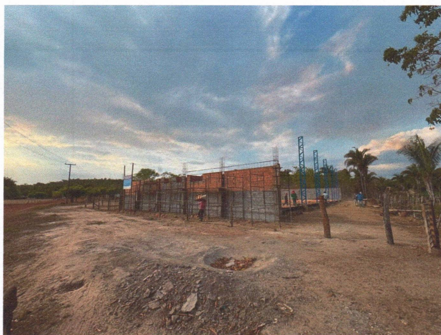
Imagem 10 – Execução de alvenaria, chapisco e estrutura metálica.