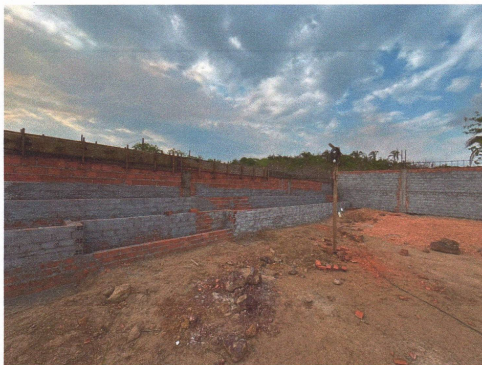
Imagem 6 – Execução da alvenaria, chapisco e aterro da quadra.