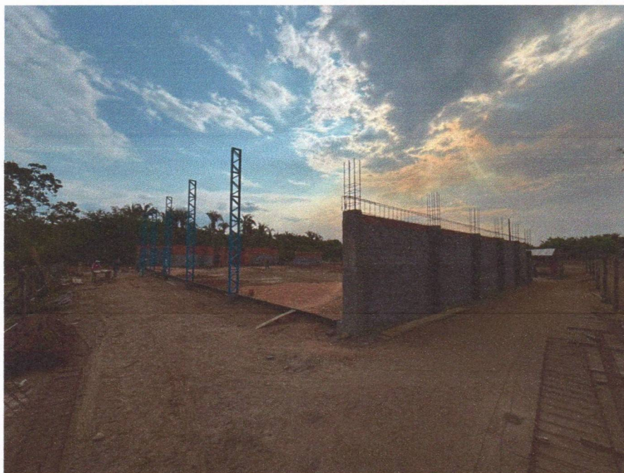
Imagem 1 – Execução da alvenaria, chapisco, armação das vigas e instalação dos pilares metálicos.

Relatório fotográfico para 3ª medição realizada "in loco" na Quadra coberta na NO POVOADO TABULEIRO DOS BATISTAS, no município Chapadina - MA, 65500-000.