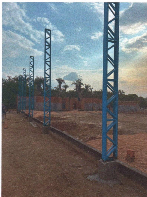
Imagem 9 – Instalação dos pilares metálicos.