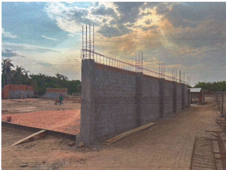
Imagem 2 – Execução da alvenaria, chapisco e armação das vigas.