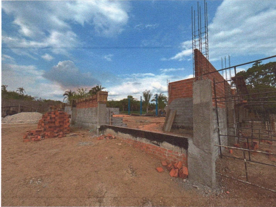
Imagem 3 – Execução da alvenaria, chapisco, armação das vigas e concretagem das vigas.