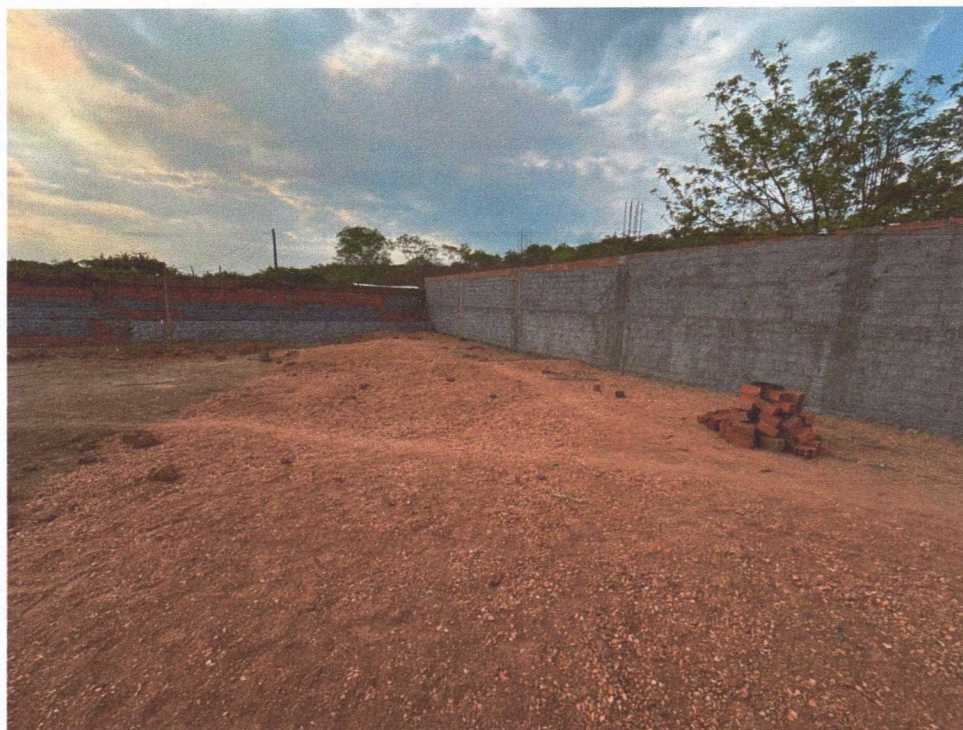
Imagem 5 – Execução da alvenaria, chapisco e aterro da quadra.