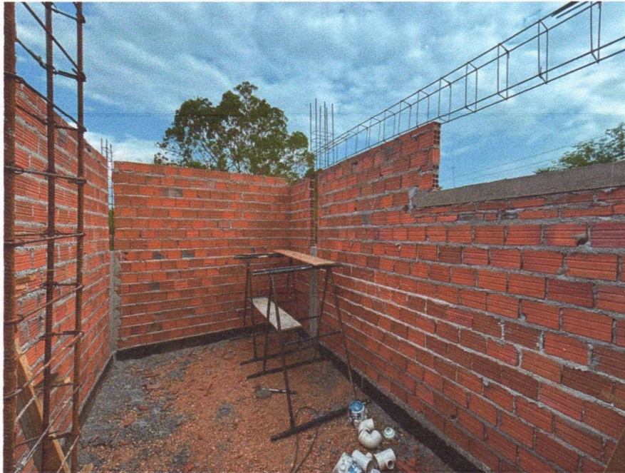
Imagem 7 – Execução da alvenaria dos banheiros e armação das vigas superiores.