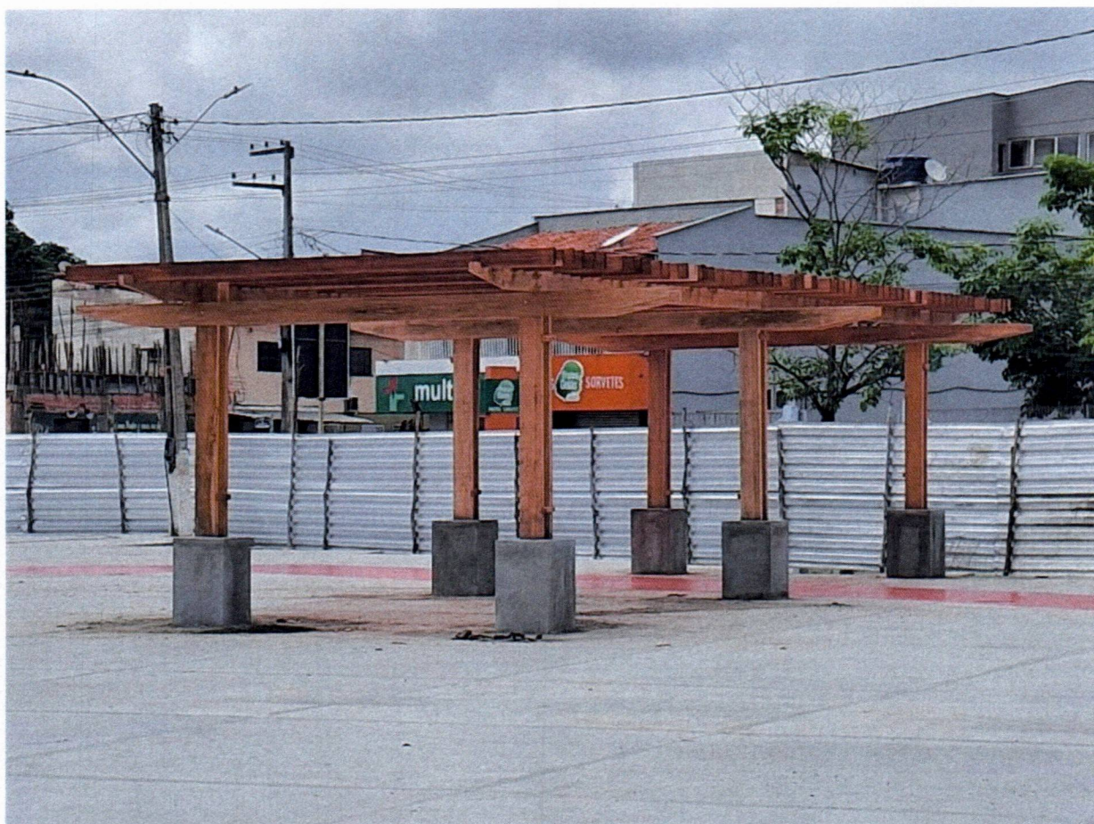
INSTALAÇÃO DE PERGOLADO DE MADEIRA