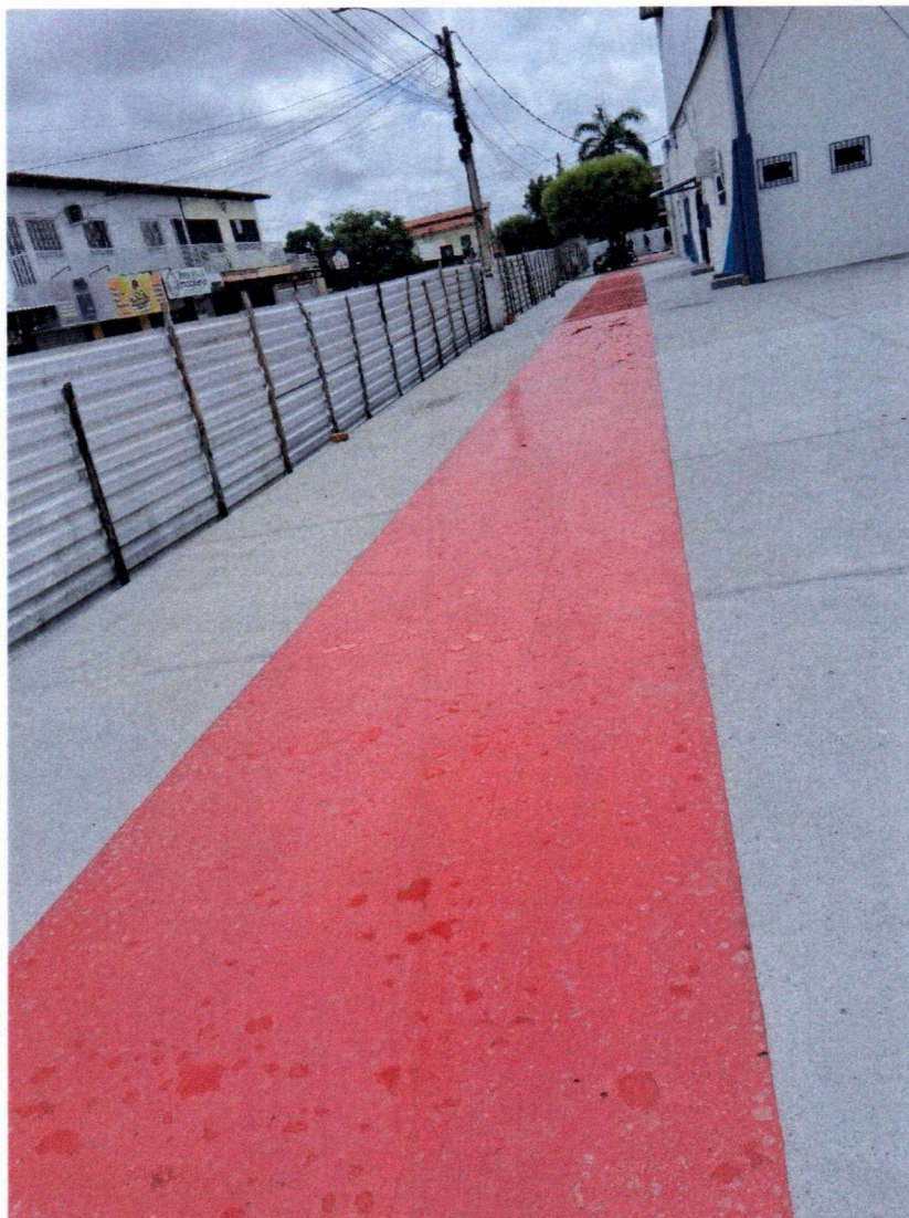
EXECUÇÃO DE PINTURA EPOXI