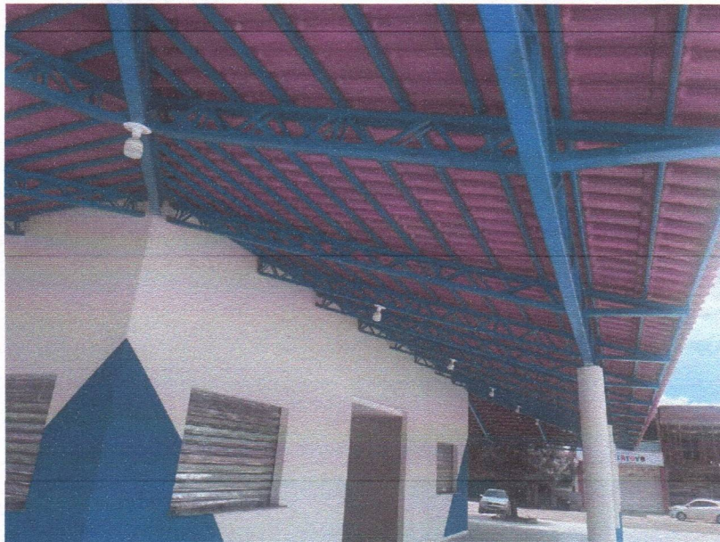
IMAGEM 05 – QUIOSQUE INSTALAÇÃO DE ESTRUTURA METALICA E TELHA DUPLANATEX