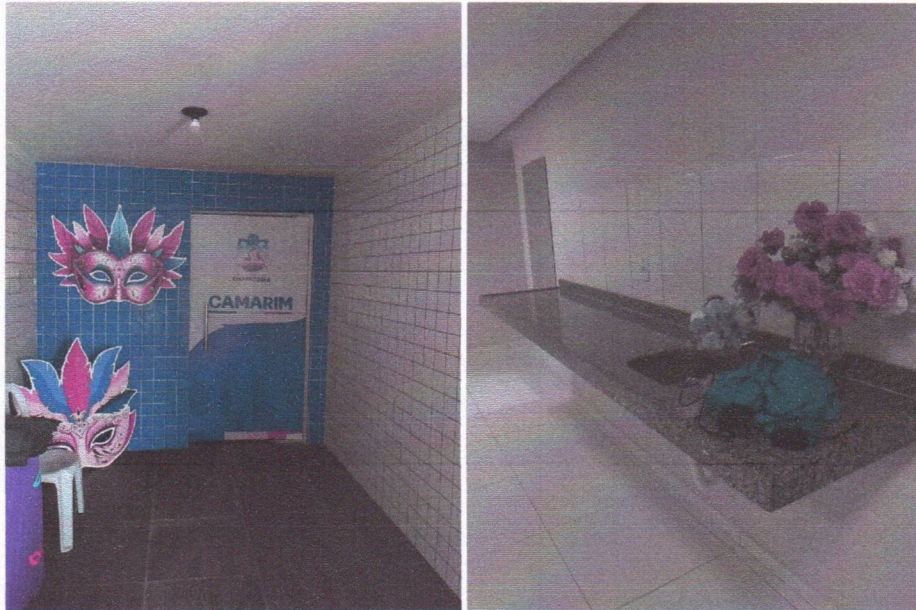
IMAGEM 01 – INSTALAÇÃO DA BANCADA E REVESTIMENTO