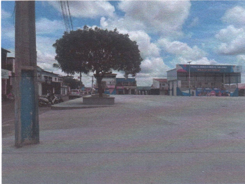
IMAGEM 09 – PISO DA PRAÇA