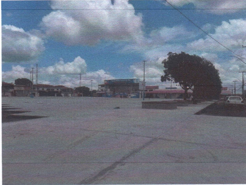
IMAGEM 07 – BANCO E PISO DA PRAÇA