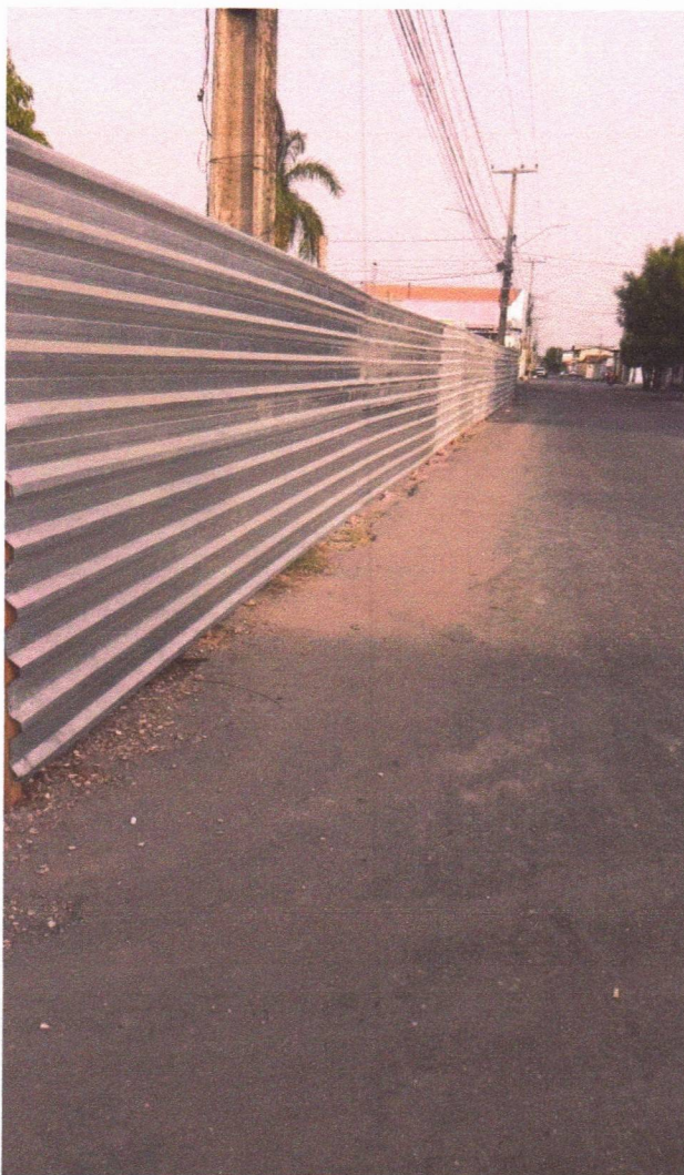
INSTALAÇÃO DE TAPUME