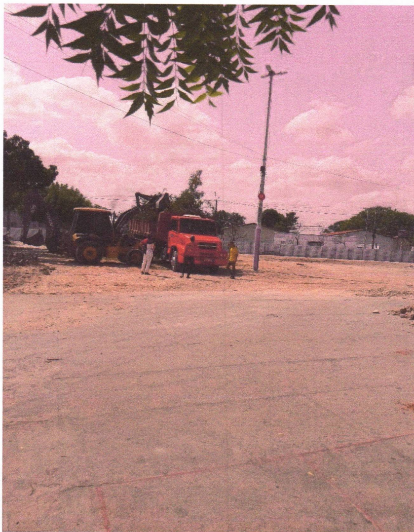
CARGA E TRANSPORTE DE MATERIAL