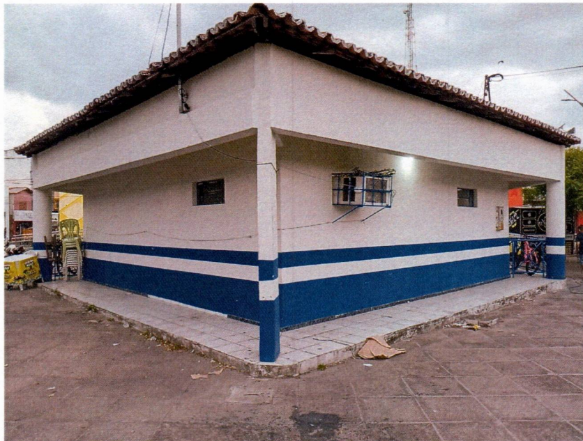
Imagem 4 – Pintura externa e retelhamento do prédio.