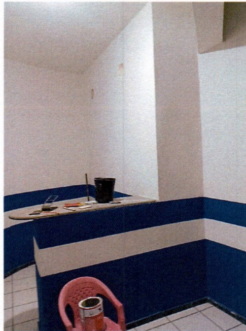
Imagem 11 – Pintura interna.