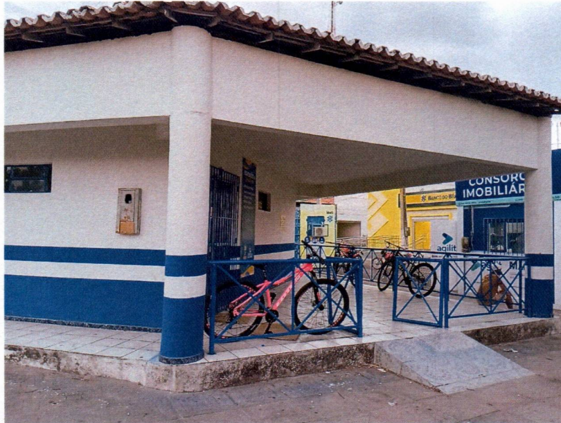
Imagem 1 – substituição dos guarda corpo, pintura externa e pintura dos guarda corpos.

Relatório fotográfico da manutenção predial do Espaço da ciência, Chapadina-MA, no município de Chapadina - MA, 65500-000.