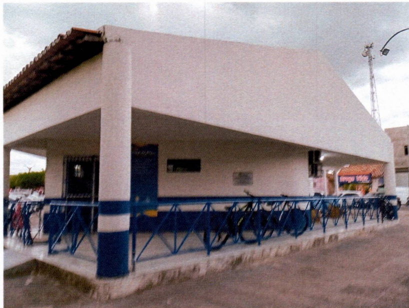
Imagem 2 – substituição dos guarda corpo, pintura externa e pintura dos guarda corpos.