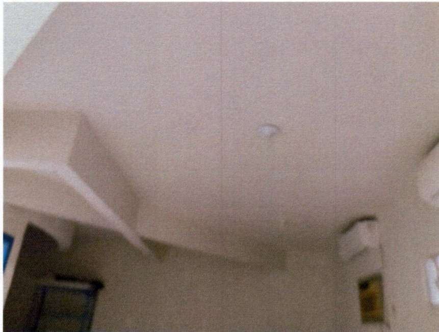
Imagem 10 – Pintura da laje.