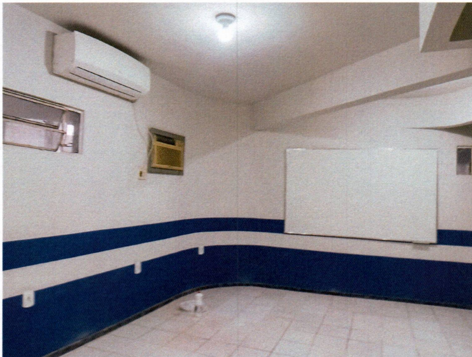
Imagem 6 – Pintura interna.