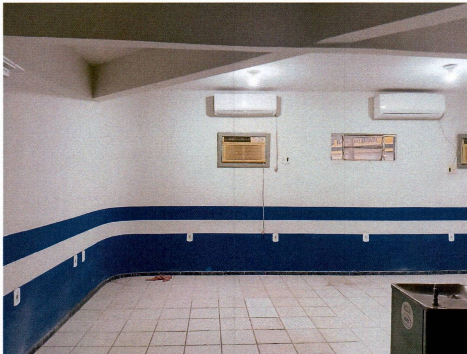
Imagem 8 – Pintura interna.