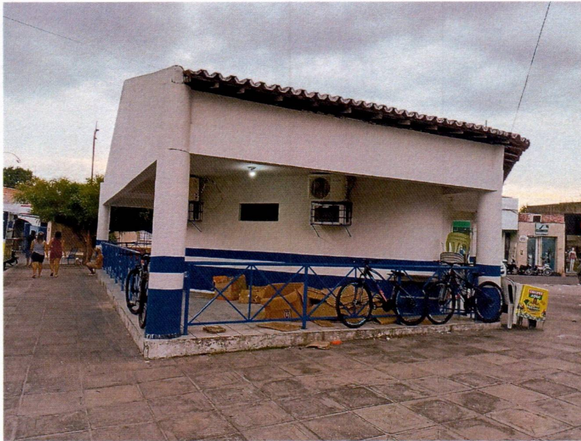
Imagem 3 – substituição dos guarda corpo, pintura externa e pintura dos guarda corpos.