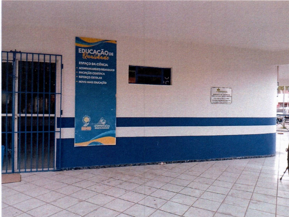
Imagem 5 – Pintura interna e pintura das grades.