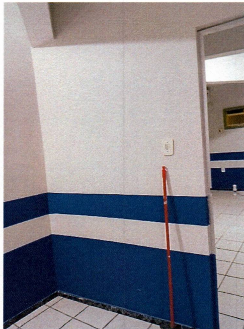
Imagem 12 – Pintura interna.