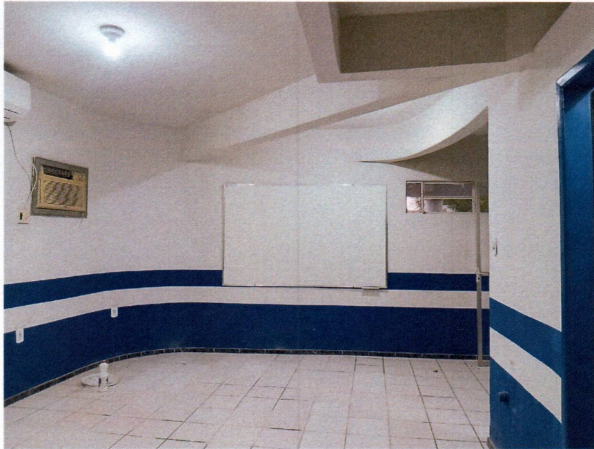
Imagem 9 – Pintura interna.