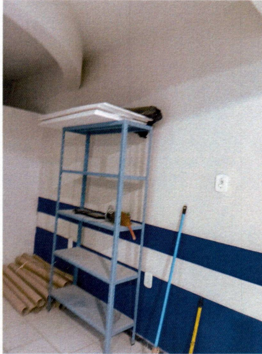
Imagem 7 – Pintura interna.