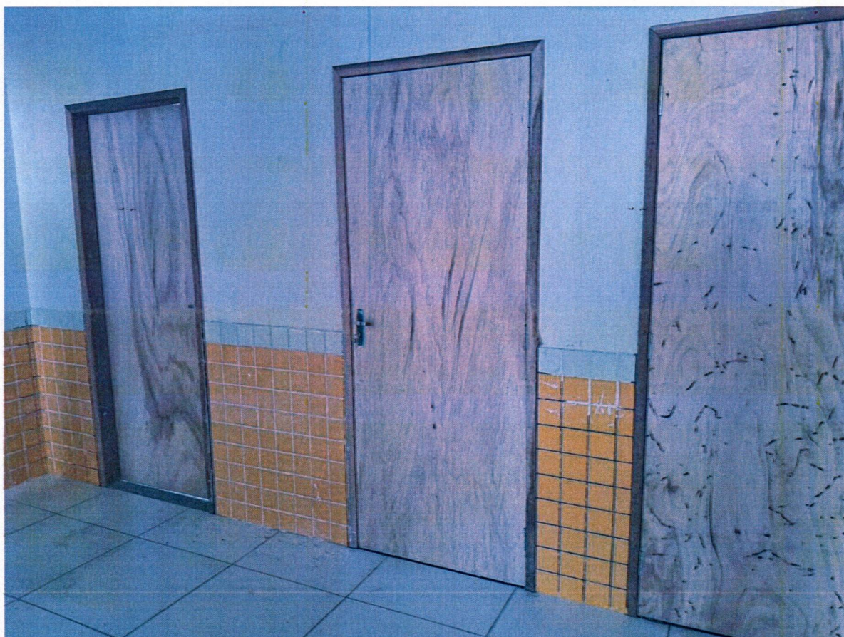
INSTALAÇÃO DE PORTAS DE MADEIRA