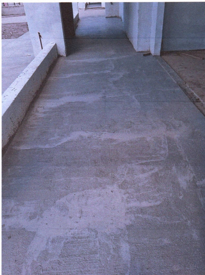
EXECUÇÃO DE PISO GRANILITE