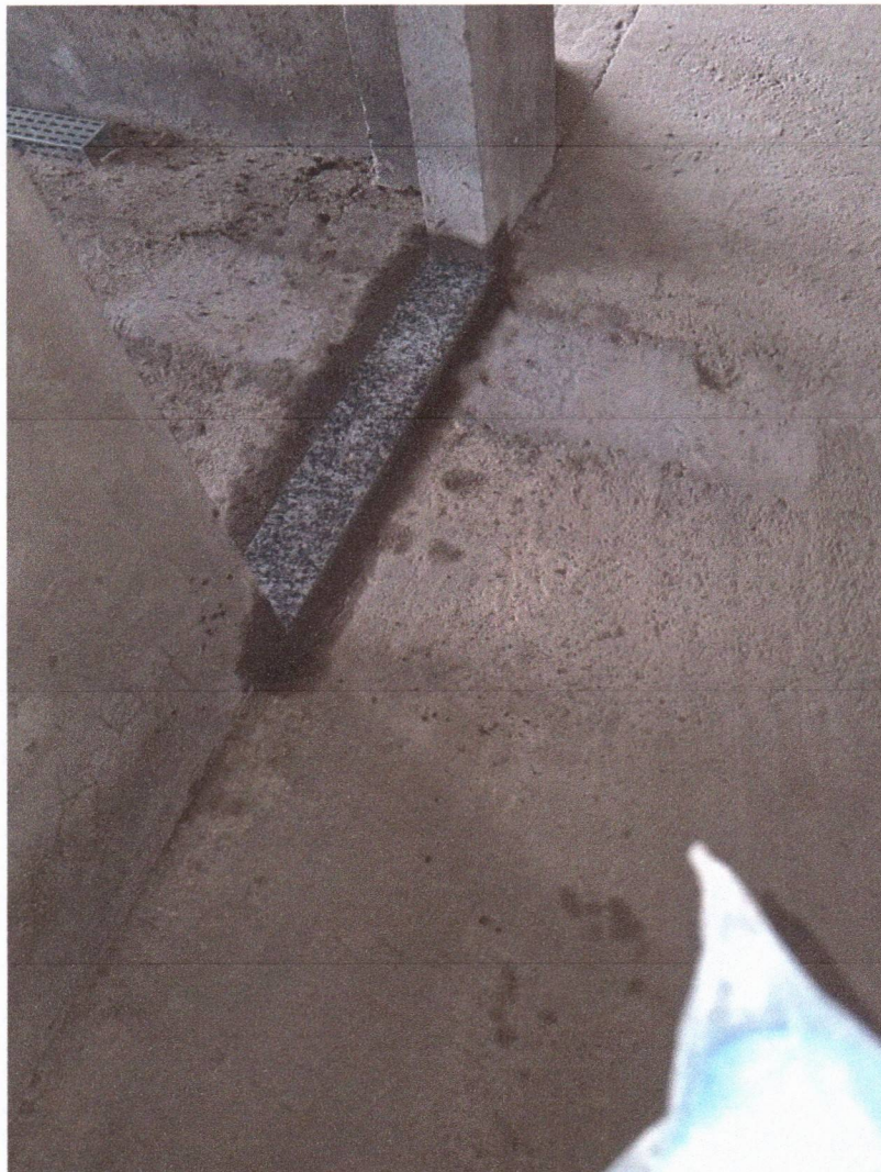
INSTALAÇÃO DE SOLEIRA