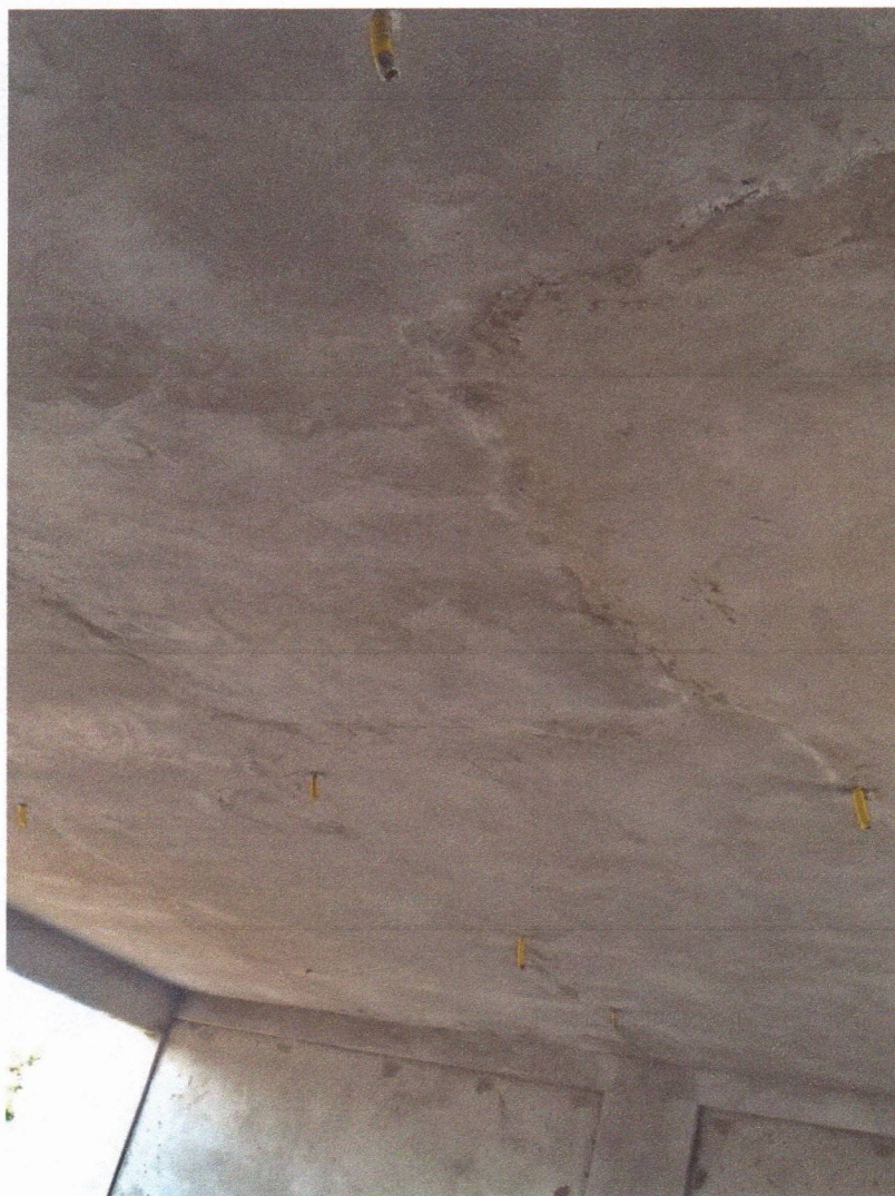
EXECUÇÃO DE REBOCO EM LAJE