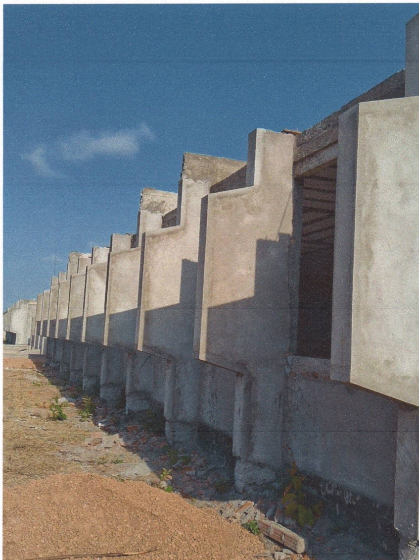
EXECUÇÃO REBOCO PILARES EXTERNOS