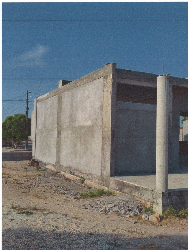
EXECUÇÃO DE REBOCO EXTERNO