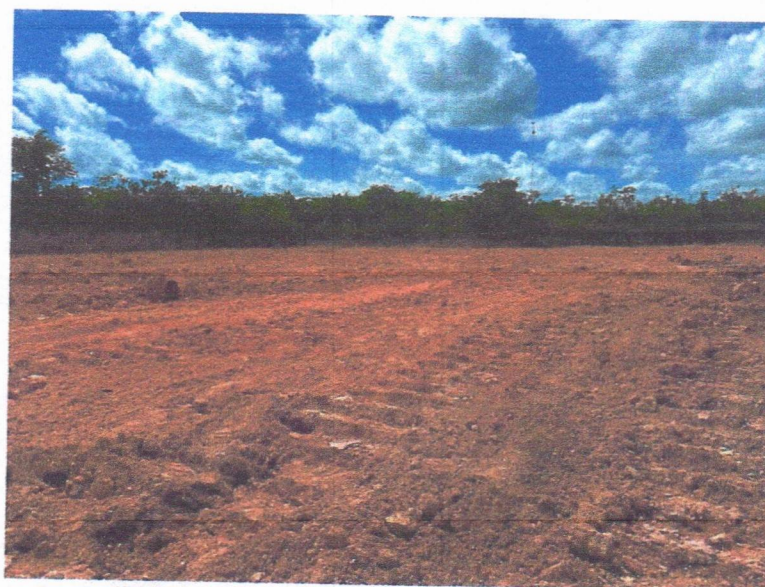
IMAGEM 10: serviços de terraplenagem