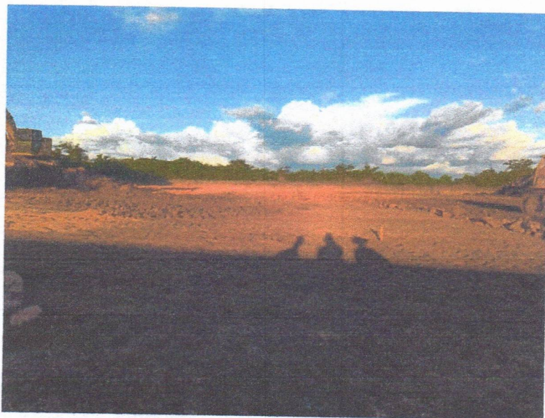
IMAGEM 7: serviços de terraplenagem