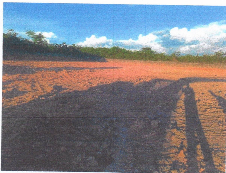
IMAGEM 8: serviços de terraplenagem