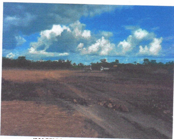
IMAGEM 3: serviços de terraplenagem