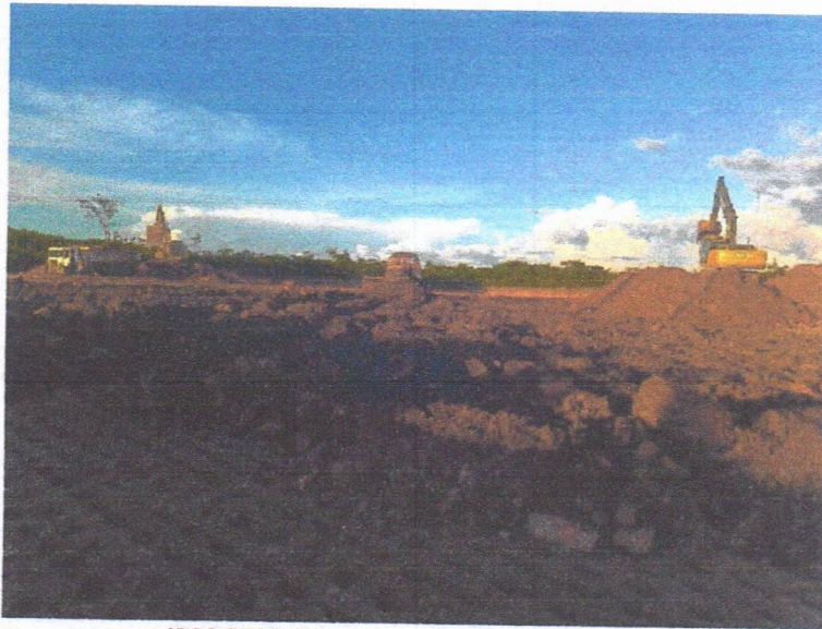
IMAGEM 1: serviços de terraplenagem