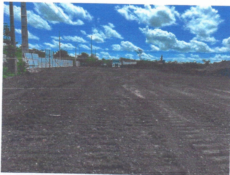
IMAGEM 09: serviços de terraplenagem