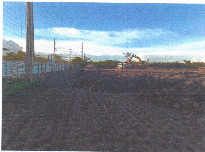
IMAGEM 6: serviços de terraplenagem

Handwritten signature or initials in blue ink.