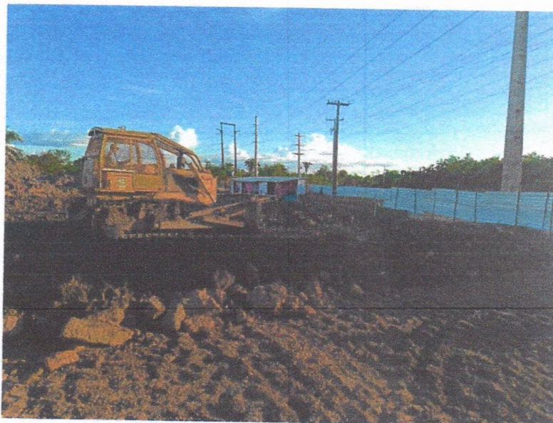
IMAGEM 2: serviços de terraplenagem