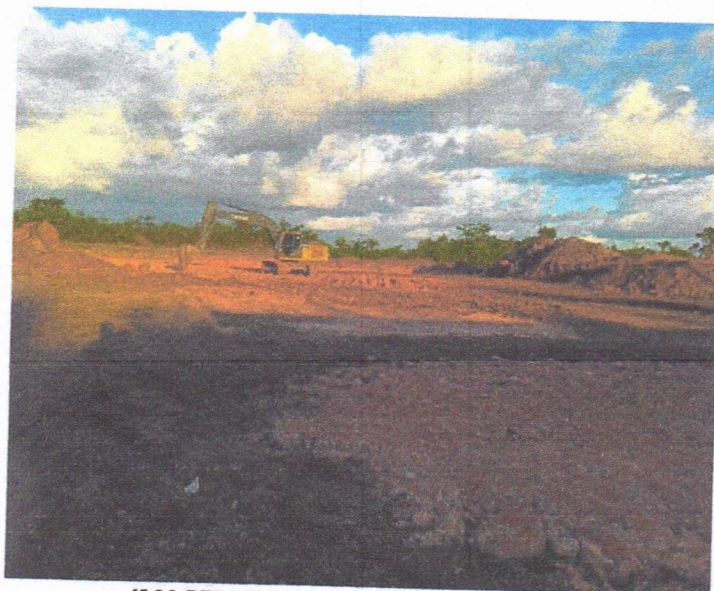
IMAGEM 4: serviços de terraplenagem