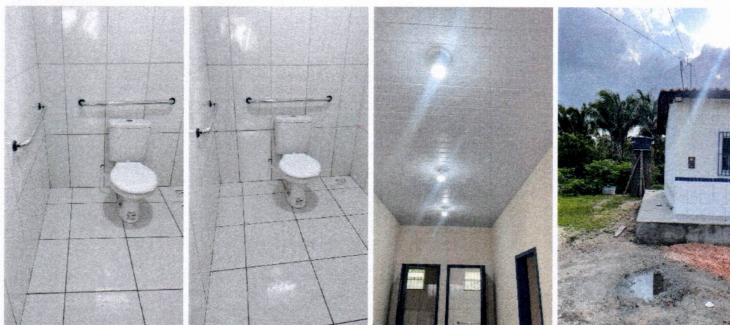
IMAGEM 01 – INSTALAÇÃO DOS VASOS, BARRA DE APOIO, APLICAÇÃO DE FORRO E ILUMINAÇÃO, EXECUÇÃO DA CALÇADA DE PASSEIO.