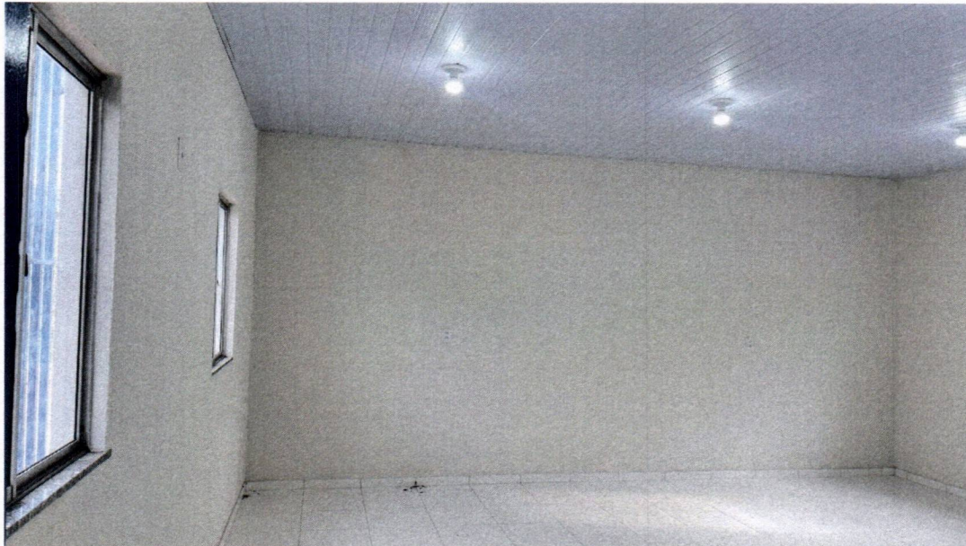
IMAGEM 06 – APLICAÇÃO DO PISO CERÂMICO; INSTALAÇÃO DO FORRO E ILUMINAÇÃO