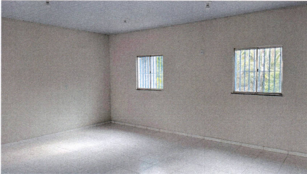
IMAGEM 05 – APLICAÇÃO DO PISO CERÂMICO; INSTALAÇÃO DAS ESQUADRIA DE VIDRO E GRADIL DE PROTEÇÃO; PINTURA GERAL