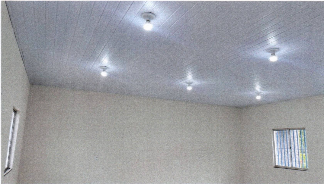
IMAGEM 07 – APLICAÇÃO DA PINTURA, INSTALAÇÃO DOS PONTOS DE LUZ E FORRO DE PVC