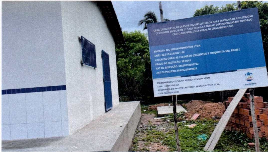
IMAGEM 03 – INSTALAÇÃO DA TRAMA DE MADEIRA; INSTALAÇÃO DAS TELHAS CERÂMICA; CHAPISCO, REBOCO EXTERNO; CALÇADA.