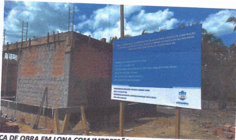
IMAGEM 01 – PLACA DE OBRA EM LONA COM IMPRESSÃO DIGITAL 1,50 X 2,00M, INCLUSIVE ESTRUTURA EM METALON 20 X 20CM E ESCORAMENTO, INSTALADA

EMPRESA: IDL EMREENDIMENTOS LTDA - CNPJ: 00.513.233/0001-98 CONTRATO: Nº 216/2025 PROCESSO ADMINISTRATIVO N.º 0184/2025 DATA: 08/10/2025