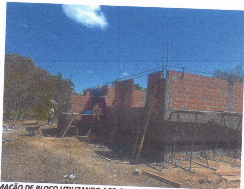
IMAGEM 06 – ARMAÇÃO DE BLOCO UTILIZANDO AÇO CA-50 DE 10 MM; CONCRETO FCK = 20MPA, TRAÇO 1:2,7:3 (CIMENTO/ AREIA MÉDIA/ BRITA 1) - PREPARO MECÂNICO COM BETONEIRA 400 L; IMPERMEABILIZAÇÃO DE SUPERFÍCIE COM EMULSÃO ASFÁLTICA, 2 DEMÃOS; ALVENARIA DE VEDAÇÃO DE BLOCOS CERÂMICOS FURADOS NA HORIZONTAL DE 9X14X19 CM (ESPESSURA 9 CM.

Jefferson Santana Costa Silva Engenheiro Civil CREA: 7120690167/MA