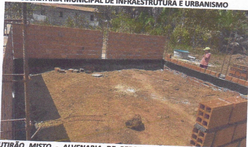
IMAGEM 03 – MUTIRÃO MISTO - ALVENARIA DE PEDRA ARGAMASSADA (TRAÇO 1:6) C/AGREGADOS ADQUIRIDOS; LASTRO DE CONCRETO MAGRO, APLICADO EM BLOCOS DE COROAMENTO OU SAPATAS, ESPESSURA DE 5 CM; FORMA PLANA PARA ESTRUTURAS, EM COMPENSADO RESINADO DE 10MM, 07 USOS, INCLUSIVE ESCORAMENTO;