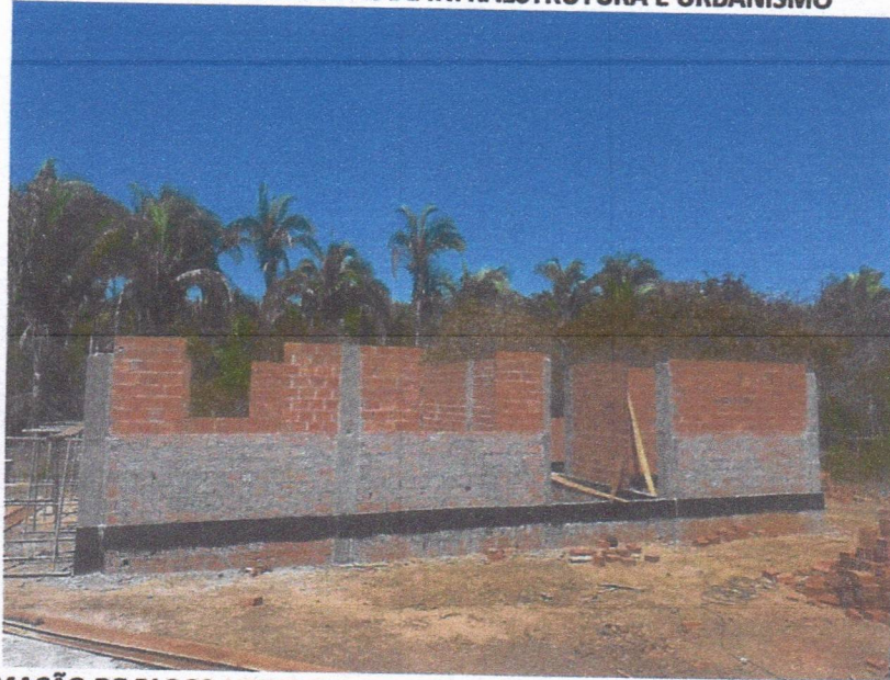
IMAGEM 07 – ARMAÇÃO DE BLOCO UTILIZANDO AÇO CA-50 DE 10 MM; CONCRETO FCK = 20MPA, TRAÇO 1:2,7:3 (CIMENTO/ AREIA MÉDIA/ BRITA 1) - PREPARO MECÂNICO COM BETONEIRA 400 L; IMPERMEABILIZAÇÃO DE SUPERFÍCIE COM EMULSÃO ASFÁLTICA, 2 DEMÃOS; ALVENARIA DE VEDAÇÃO DE BLOCOS CERÂMICOS FURADOS NA HORIZONTAL DE 9X14X19 CM (ESPESSURA 9 CM.