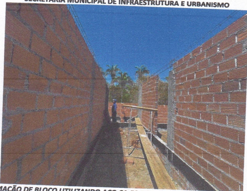
IMAGEM 05 – ARMAÇÃO DE BLOCO UTILIZANDO AÇO CA-50 DE 10 MM; CONCRETO FCK = 20MPA, TRAÇO 1:2,7:3 (CIMENTO/ AREIA MÉDIA/ BRITA 1) - PREPARO MECÂNICO COM BETONEIRA 400 L; IMPERMEABILIZAÇÃO DE SUPERFÍCIE COM EMULSÃO ASFÁLTICA, 2 DEMÃOS; ALVENARIA DE VEDAÇÃO DE BLOCOS CERÂMICOS FURADOS NA HORIZONTAL DE 9X14X19 CM (ESPESSURA 9 CM.