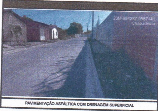
PAVIMENTAÇÃO ASFÁLTICA COM DRENAGEM SUPERFICIAL