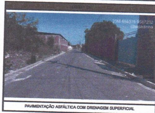
PAVIMENTAÇÃO ASFÁLTICA COM DRENAGEM SUPERFICIAL