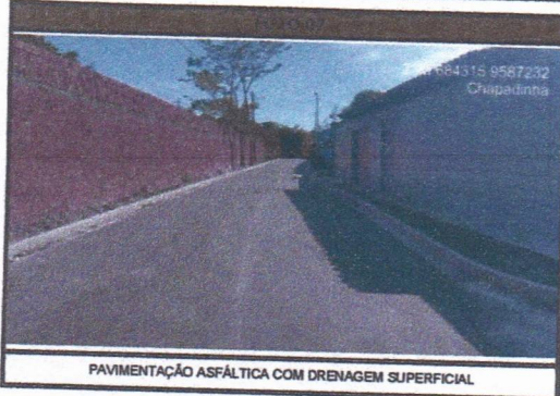
PAVIMENTAÇÃO ASFÁLTICA COM DRENAGEM SUPERFICIAL