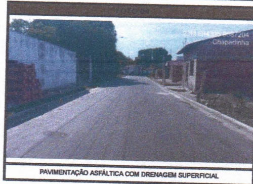
PAVIMENTAÇÃO ASFÁLTICA COM DRENAGEM SUPERFICIAL