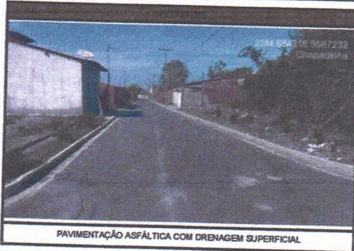
PAVIMENTAÇÃO ASFÁLTICA COM DRENAGEM SUPERFICIAL