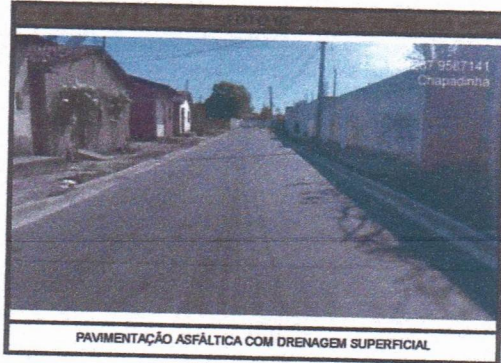
PAVIMENTAÇÃO ASFÁLTICA COM DRENAGEM SUPERFICIAL