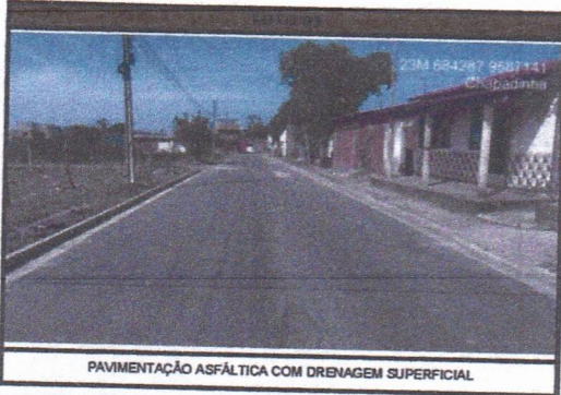
PAVIMENTAÇÃO ASFÁLTICA COM DRENAGEM SUPERFICIAL