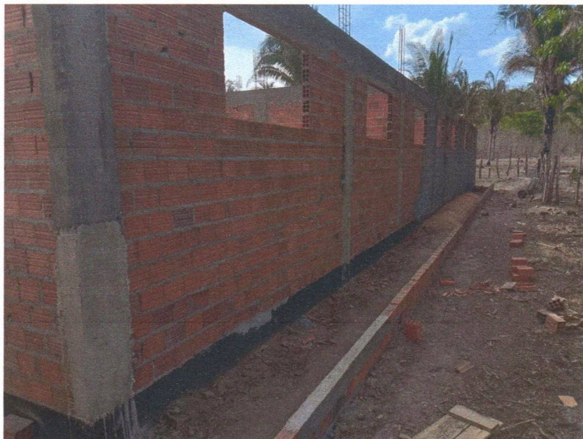
Imagem 2 – Execução da viga superior e calçada.