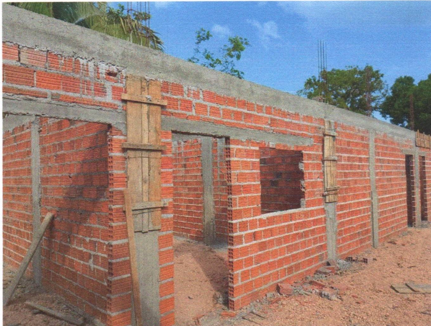
Imagem 3 – Execução da viga superior.