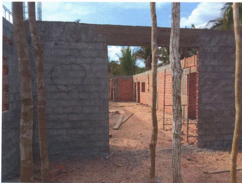
Imagem 5 – Execução da viga superior e do chapisco.