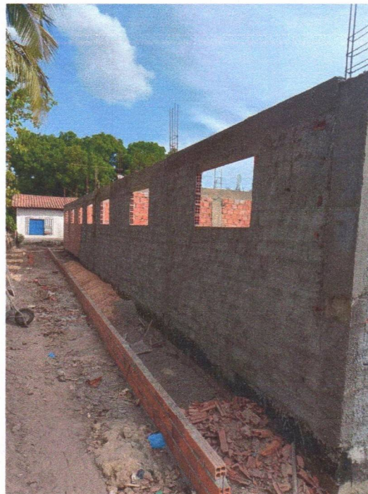
Imagem 4 – Execução da viga superior e do chapisco.