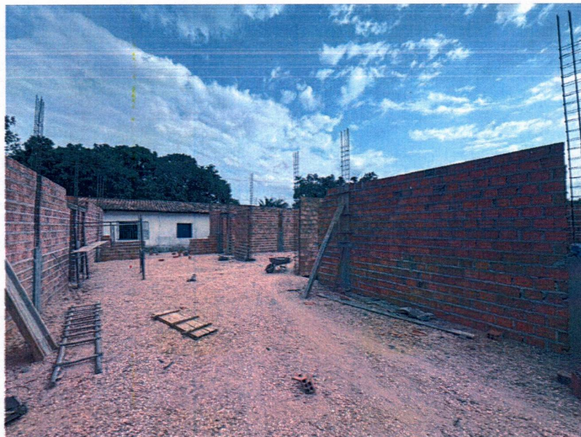
Imagem 5 – Execução da alvenaria, concretagem dos pilares e aterro da escola.