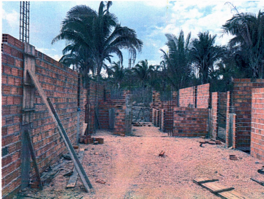
Imagem 4 – Execução da alvenaria, concretagem dos pilares e aterro da escola.