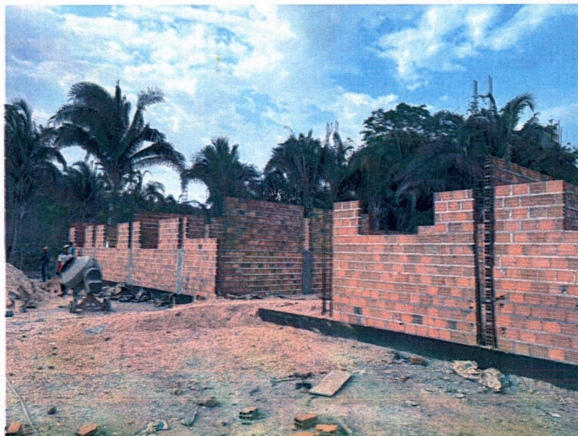
Imagem 2 – Execução da alvenaria e concretagem dos pilares.