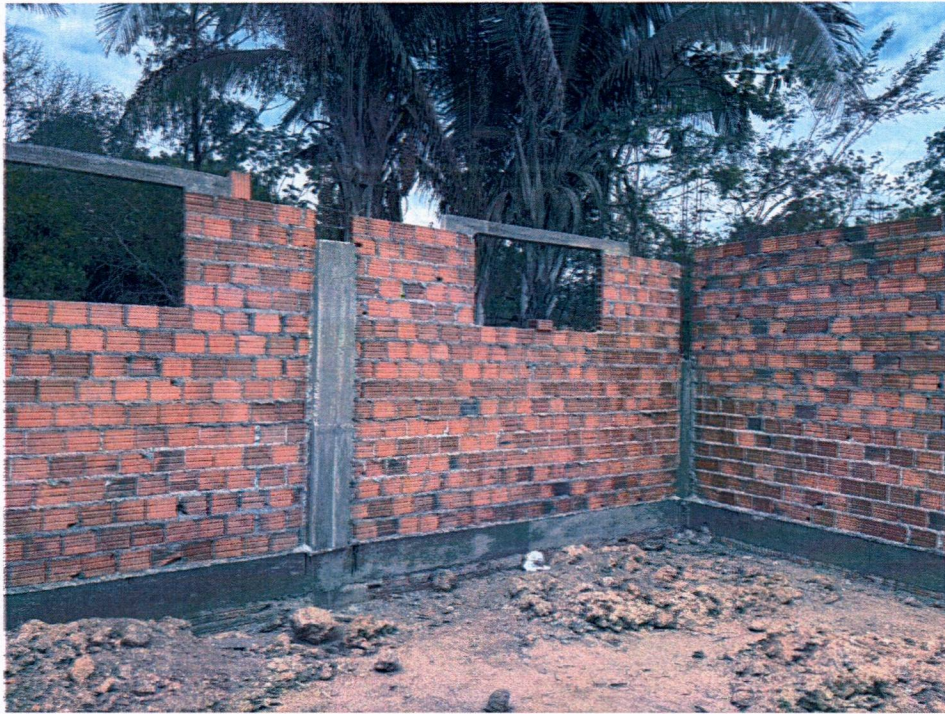
Imagem 8 – Execução da alvenaria, concretagem dos pilares e vergas das janelas.