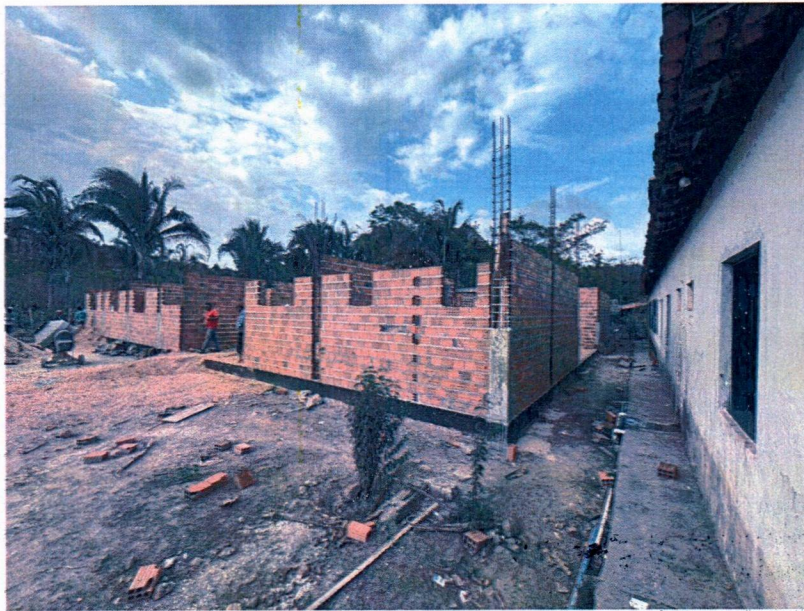
Imagem 1 – Execução da alvenaria e concretagem dos pilares.

Relatório fotográfico para 2ª medição realizada "in loco" na escola de 6 salas NO POVOADO TABULEIRO DOS BATISTAS, no município Chapadinda - MA, 65500-000.