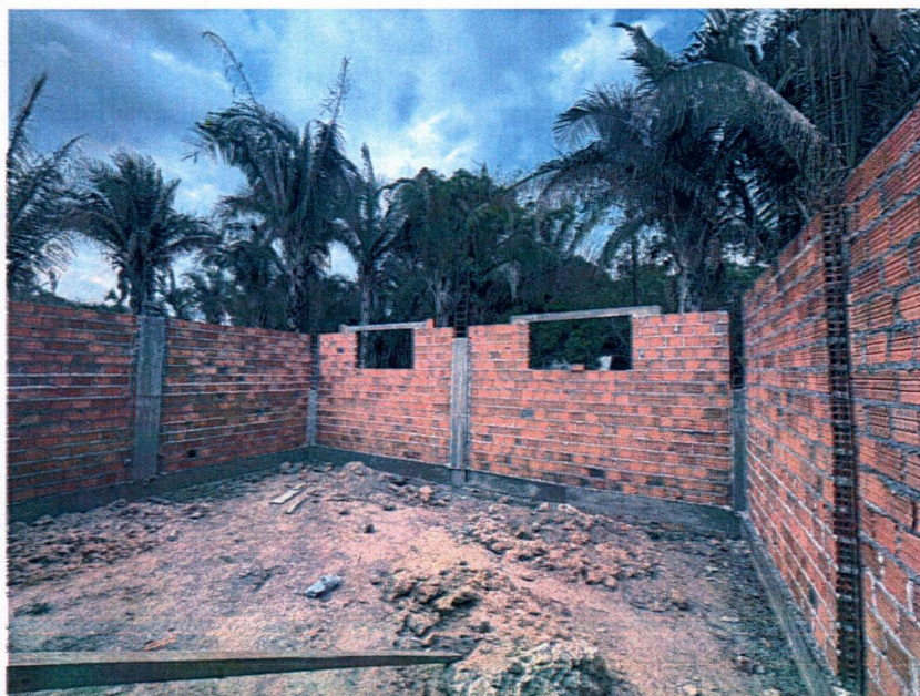
Imagem 6 – Execução da alvenaria, concretagem dos pilares e vergas das janelas.