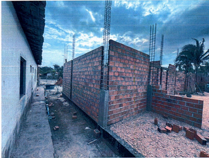
Imagem 3 – Execução da alvenaria e concretagem dos pilares.