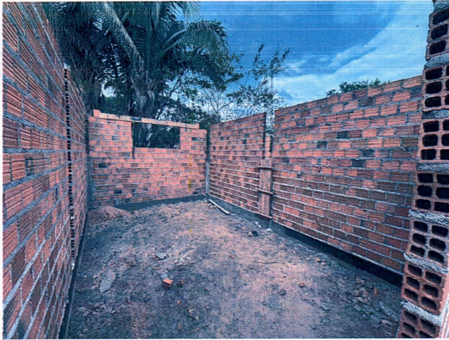
Imagem 7 – Execução da alvenaria, concretagem dos pilares e vergas das janelas.